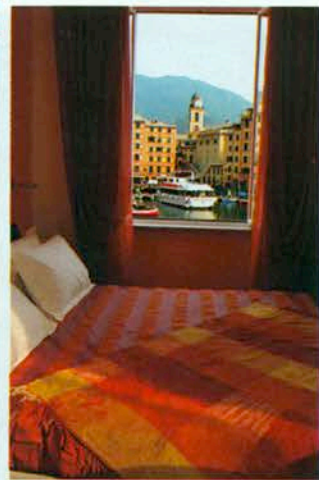
Camera con vista La Locanda i Tre merli si affaccia sul porticciolo di Camogli. «Vi coccoleremo tutto il giorno» promette il sito dell'hotel.

Più nell'interno, immerso com'è nella campagna senese, il Relais La Leopoldina (Relaisleopoldina.it) è un casale di fine '700 costruito nel periodo di ammodernamento edilizio promosso dal granduca Pietro Leopoldo di Lorena.