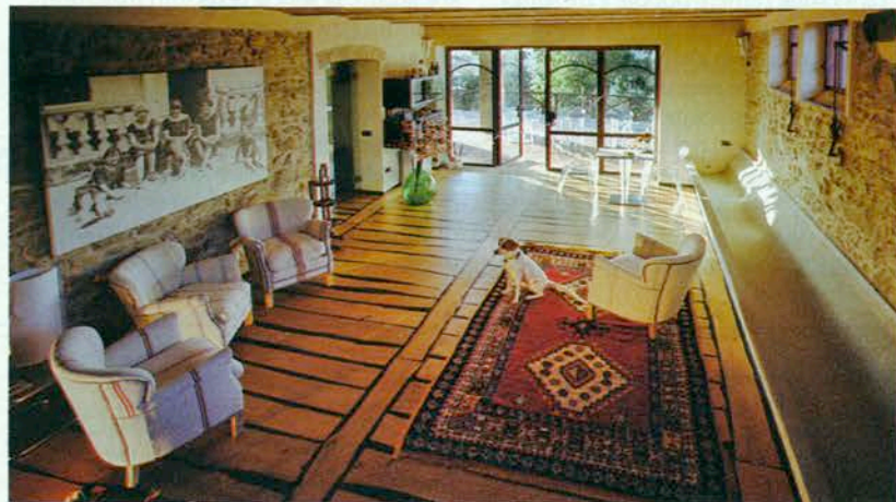
Ritratto di famiglia Il salone del Relais Vedetta, nel cuore della Maremma.

In Sicilia, infine, il concetto di familiarità si estende anche agli animali. A Modica, in provincia di Ragusa, c'è il Balarte Hotel & Other (Balarte.it), un albergo a metà tra spazio espositivo e resort di lusso. Conta sette suite uniche, non solo perché diverse l'una dall'altra, ma perché in questa sorta di «museo da abitare» le opere d'arte sono proprio le stanze: spazi-installazioni di giovani artisti (prezzi da 100 a 180 euro a notte per due persone, prima colazione compresa). L'idea in più? Che per far sentire a proprio agio gli ospiti la struttura si apre ai quattro zampe. A disposizione dei clienti infatti ci sono 10 spaziosi alloggi dove fare soggiornare cani, gatti, cavalli... Gli animali che viaggiano homy apprezzeranno. ■